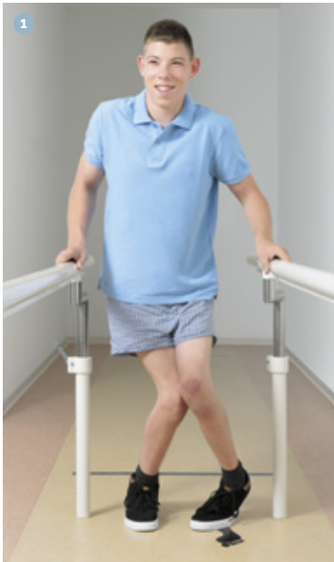
● Ohne Cosa Active