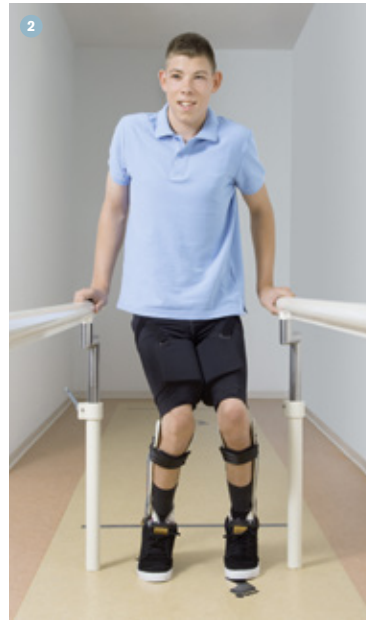
● Mit Cosa Active

Die Funktionalität der Hüftabduktionsorthese ist ebenso einfach wie effektiv: Die Polster in der Hose übernehmen die Funktion von Abstandshaltern, sodass es dem Anwender möglich wird, die Beine trotz starker Zugkraft aneinander vorbei zu führen.