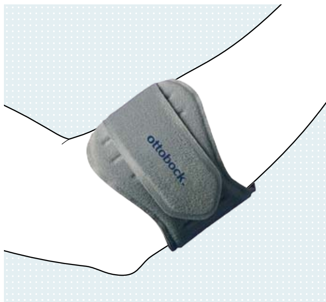
• Epi Forsa Plus Stabilorthese

Wie die Epi Forsa Plus richtig angelegt wird, zeigt Ihnen Ihr medizinischer Fachhändler, bei dem Sie Ihr Rezept einlösen. Die Epi Forsa Plus ist aus einem angenehmen, hautfreundlichen Material mit modernsten Fertigungstechnologien hergestellt. Sie bietet ein komfortables Tragegefühl auch bei „schweißtreibenden“ Tätigkeiten.