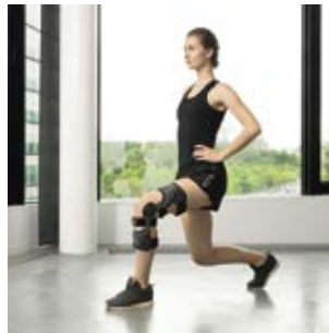
BALANCE AB PHASE 3