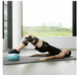
BALANCE AB PHASE 3