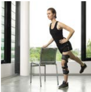
BALANCE AB PHASE 2

Wenn Sie zur Mehrzahl der Patienten gehören und konsequent trainiert haben, sollten Sie sich jetzt wieder natürlich und schmerzfrei bewegen können. Auch das sichere Springen sollte in dieser letzten Phase wieder möglich sein. Glückwunsch! Das Training hat sich ausgezahlt.